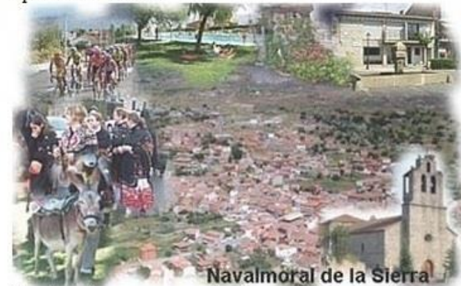
Navalmoral de la Sierra

Navalmoral de la Sierra , una preciosa Villa situada en la provincia de Ávila, a 30Km al sur de la capital por la Av-900, con 1045 m. de altitud, regado por uno de los afluentes del río Alberche. Destaca su gran Iglesia San Pedro Apostol del S. XVI.